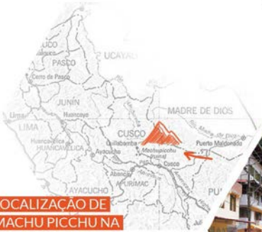
LOCALIZAÇÃO DE MACHU PICCHU NA REGIÃO DE CUZCO