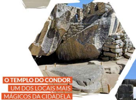
O TEMPLO DO CONDOR UM DOS LOCAIS MAIS MÁGICOS DA CIDADELA