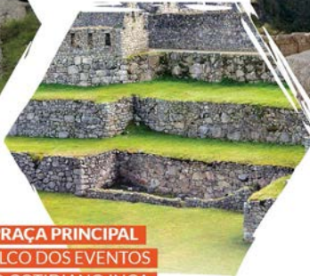
PRAÇA PRINCIPAL PALCO DOS EVENTOS DO COTIDIANO INCA