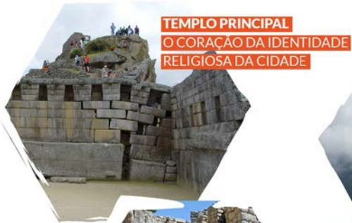
TEMPLO PRINCIPAL O CORAÇÃO DA IDENTIDADE RELIGIOSA DA CIDADE