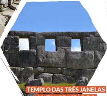
TEMPLO DAS TRÊS JANELAS A MELHOR VISÃO DO VALE DO URUBAMBA